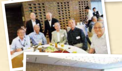
ぜひ、今年は皆さんも参加してください