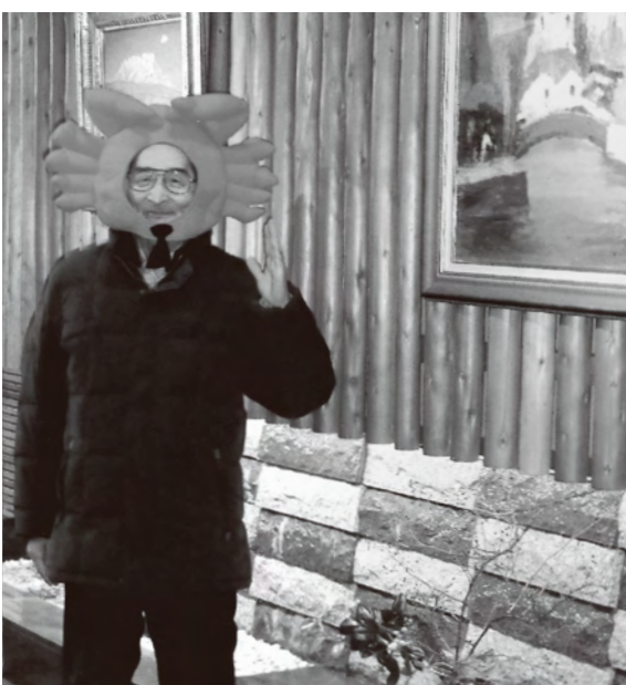
去年の12月、高齢者親睦会の研修旅行で訪れた、はわい温泉(鳥取県東伯郡湯梨浜町)の旅館「千年亭」でのスナップ。ロビーに置かれていたカニのかぶりものを笑顔でパチリ!