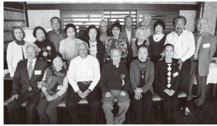
1期生(昭和28年卒業)鳳一会 平成27年度同窓会 平成27年11月6日(金) 阪急グランドビル 白楽天にて開催 参加者20名 傘寿を過ぎ次は米寿か?

連絡先 吹田高校内「鳳志会事務局」 TEL.06-6387-6651 FAX.06-6387-6567