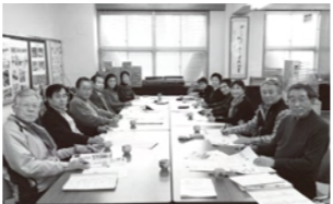
編集会議の様子(吹田高校にて)

●20期新人編集員4名、先輩の足をひっぱらぬ様にやっております。困った事に編集会議の日に限って雨が降っていますが、順調に進んでいます。初めての編集参加で、出来上りが楽しみです。(峰)