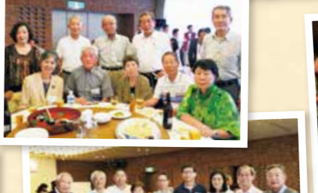
吹高の仲間は最高です!