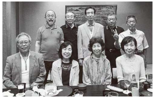
15期生 3年1組(昭和42年卒業)クラス会 平成27年6月27日(土) 曾根崎「八幸」 卒業後45年を期に平成24年6月から毎年開催しています。吹高での思い出、現在の生活など語り合えたら幸いです。(連絡先:寺本、前田)