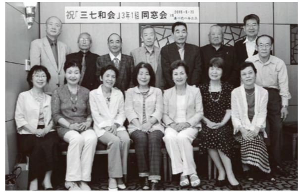
10期生(昭和37年卒業)3年1組 同窓会 平成27年5月23日(土)大阪市内の「あべのハルカス近鉄本社」内の「桃谷楼」にて、15人が参加し開催しました。53年前にタイムスリップして話が弾み、あっという間に3時間が過ぎ、お開きになりました。なお、次回の開催は、平成28年の予定となりました。世話人住所 631-0831 奈良市西大寺宝ヶ丘 2-17-5 真野 雅弘