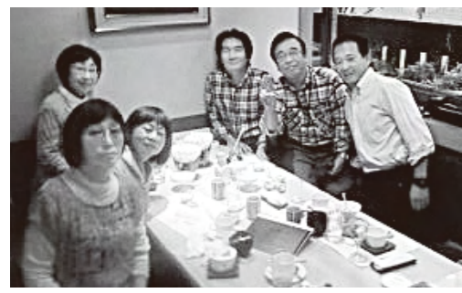
20期生(昭和47年卒業)3年4組 クラス会 平成27年11月8日がご梅田店にて第3回クラス会を行いました。当日は雨の中7名の参加者でした。楽しかったです。今年も開催いたします。次は平成28年11月12日の予定です。ぜひ御参加下さい。