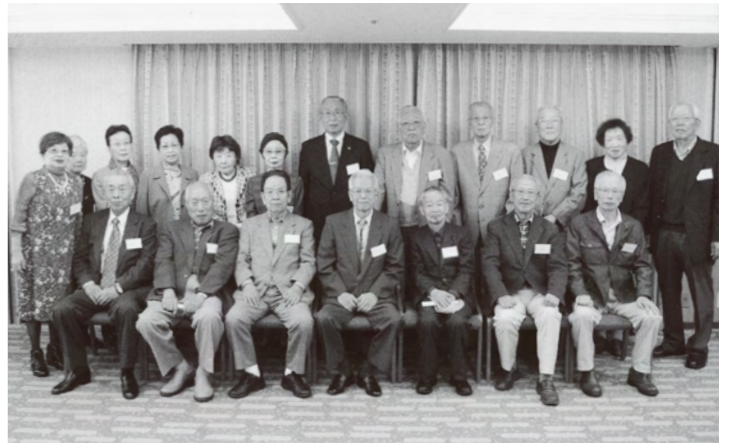
2期生(昭和29年卒業)2期の会 第9回 同窓会 開催日 平成27年11月8日(日) 開催場所 ホテルグランヴィア大阪 参加者 19名 時間の許す限り楽しく過ごしました。 記事 傘寿を迎えたのをきりとして2期会の会を終わりとしました。 同期の皆さんの御多幸とご健勝を祈念致します。(幹事一同)