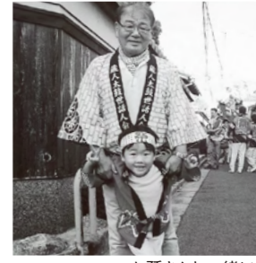
お孫さんと一緒に

のことで、その活動が、「功を奏して事なきを得た」のも、他方、「力及ばず悲しい結末」もあり、数多の感慨が今も脳裏に去来します。 私は吹高に入ってから、柔道を始めました。当時、柔道の同期生とは仲がよく、休日にはキャンプや自転車で京都観光等のレジャーで友情を深めたのが、今も懐かしく思い出します。 柔道は、卒業後も40代半ばまで続けましたが、永く柔道が続けたことで、「恩恵」が二つございます。それは、今から3年前、自転車で歩道に入る時、かなりの段差があるにもかかわらず