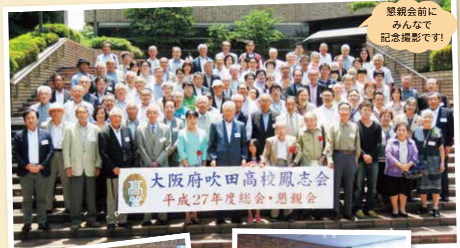
懇親会前にみんなで記念撮影です!

場所 / 吹田市文化会館(メイシアター) レセプションホール 吹田市泉町2丁目29-1 (阪急千里線 吹田駅下車徒歩) ☎06-6380-2221 総会 / 午前11時~午前11時45分 懇親会 / 正午~午後2時 会費 / 5,000円(ただし、63・64期生は無料)